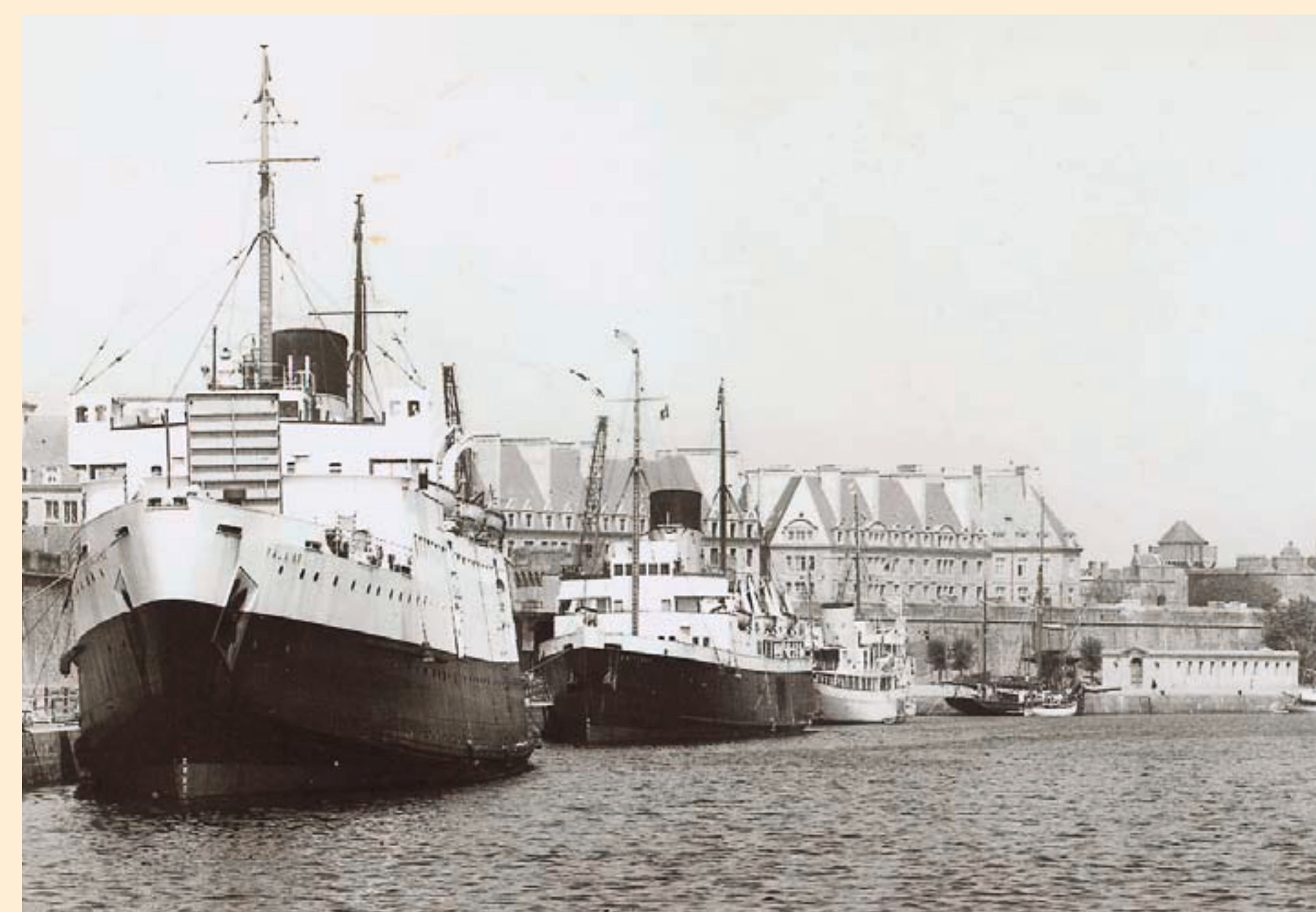
Le Falaise et le Brittany à quai dans le bassin Vauban. Carte postale, éd. Cap, 1961, Collection Y. De Boodt.