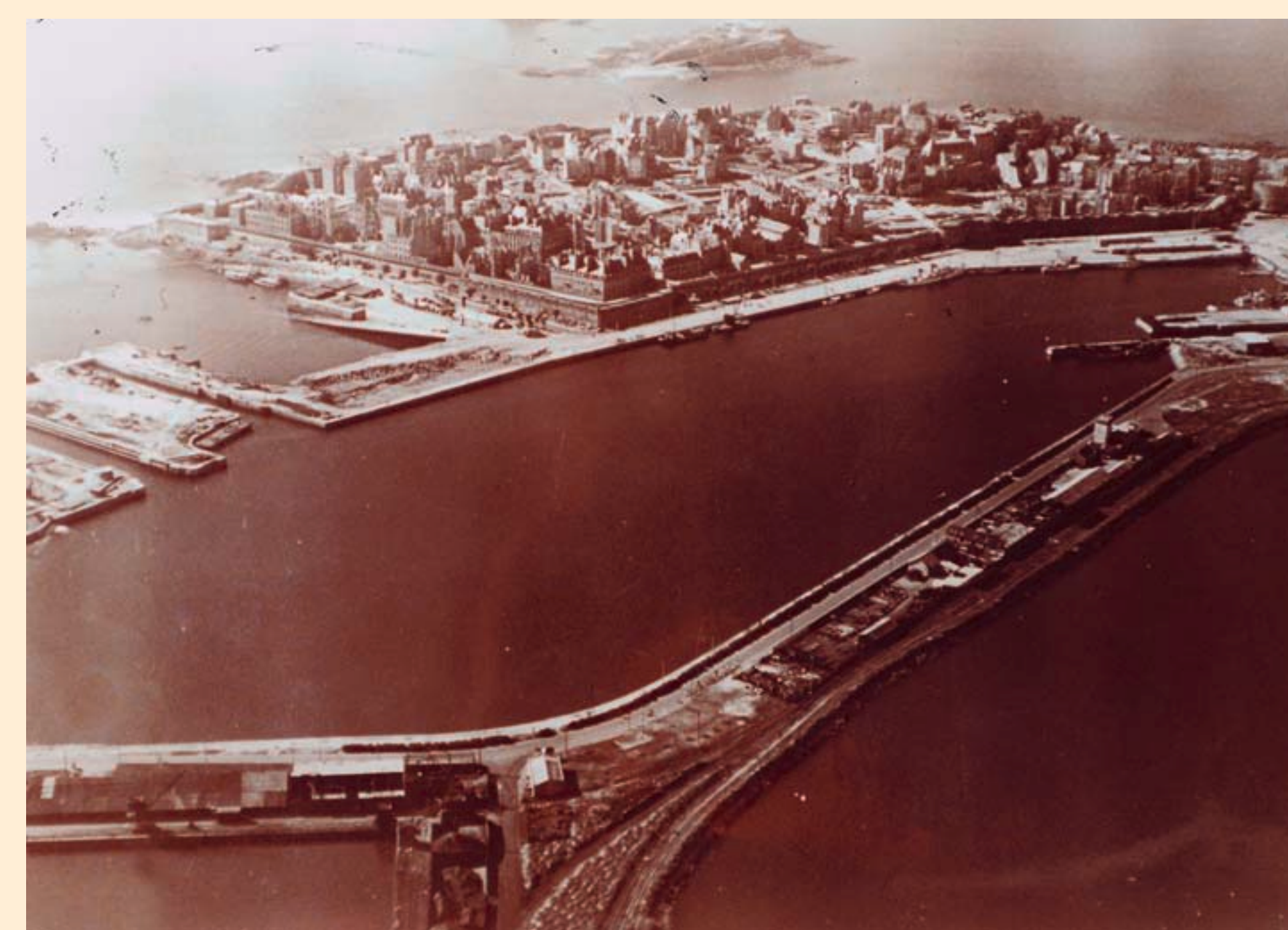
Saint-Malo et Saint-Servan. Photographie aérienne, 1948.