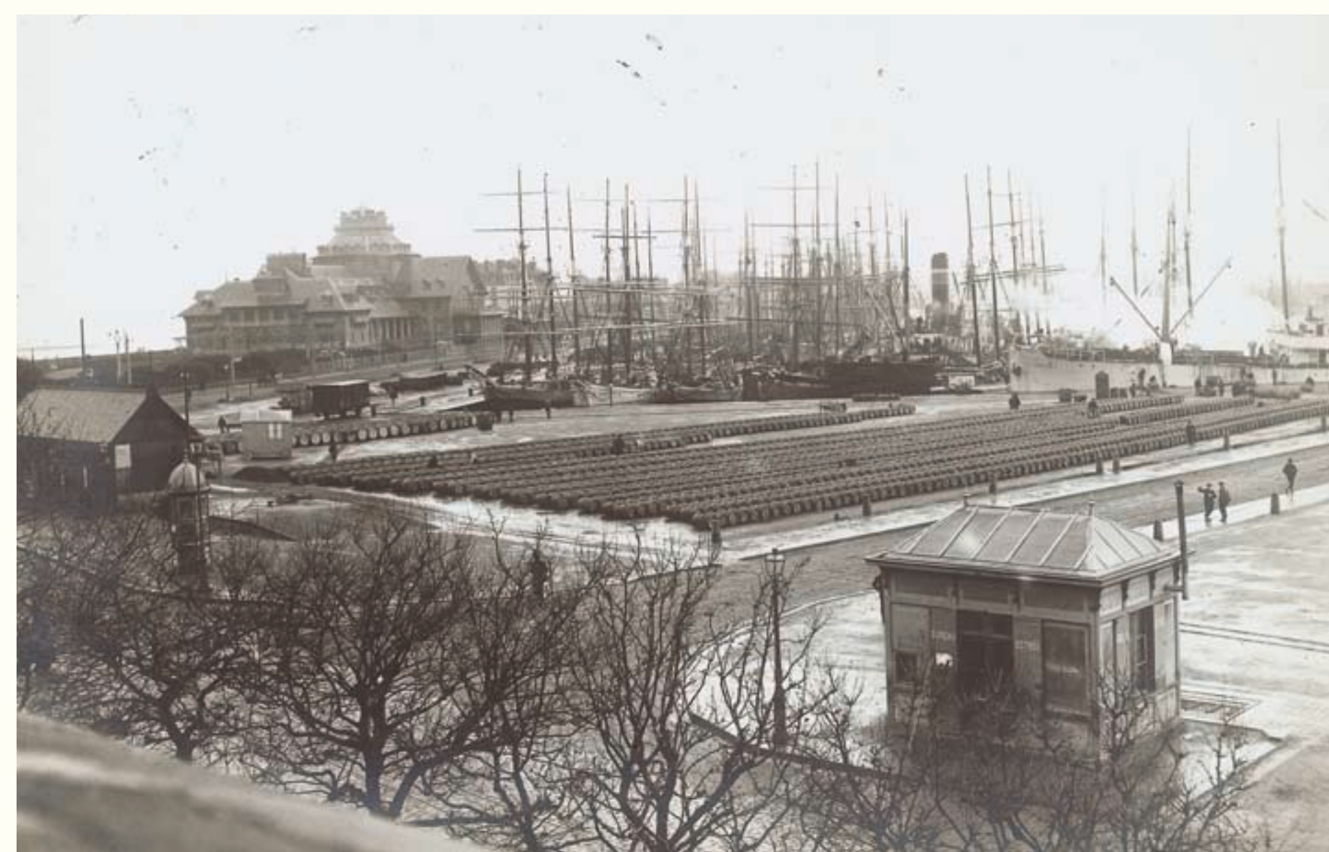
Saint-Malo, vue du bassin et des quais. Carte postale, éd. Germain fils, début XX e siècle, Collection privée. Les goélettes "encombrent" le port lors de la préparation et au retour des campagnes de grande pêche.