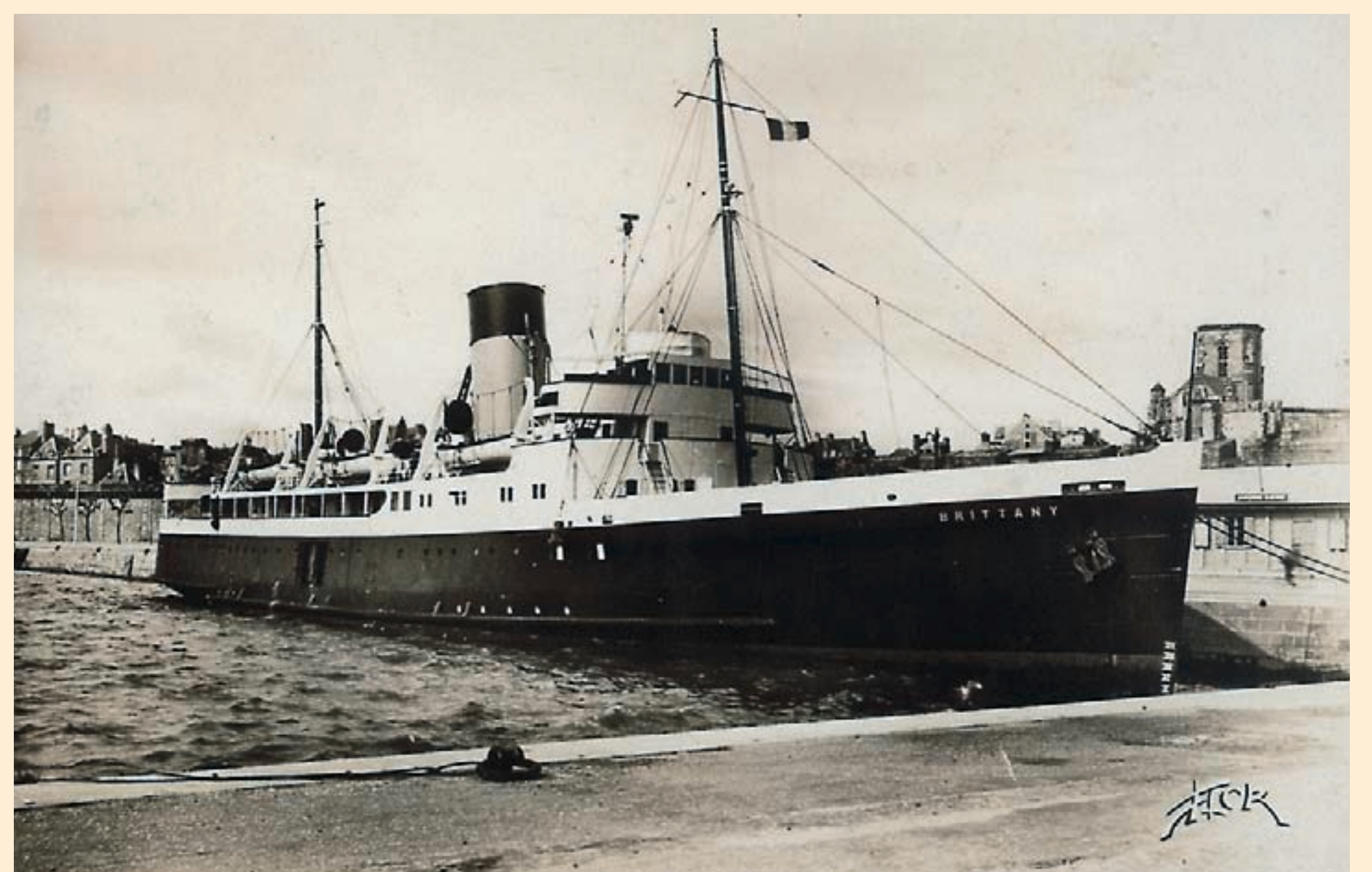
Saint-Malo, le premier voyage de retour du Brittany en avril 1946. Carte postale, éd. Marceau Carrière, fin années 1940, Collection Roland Brault.