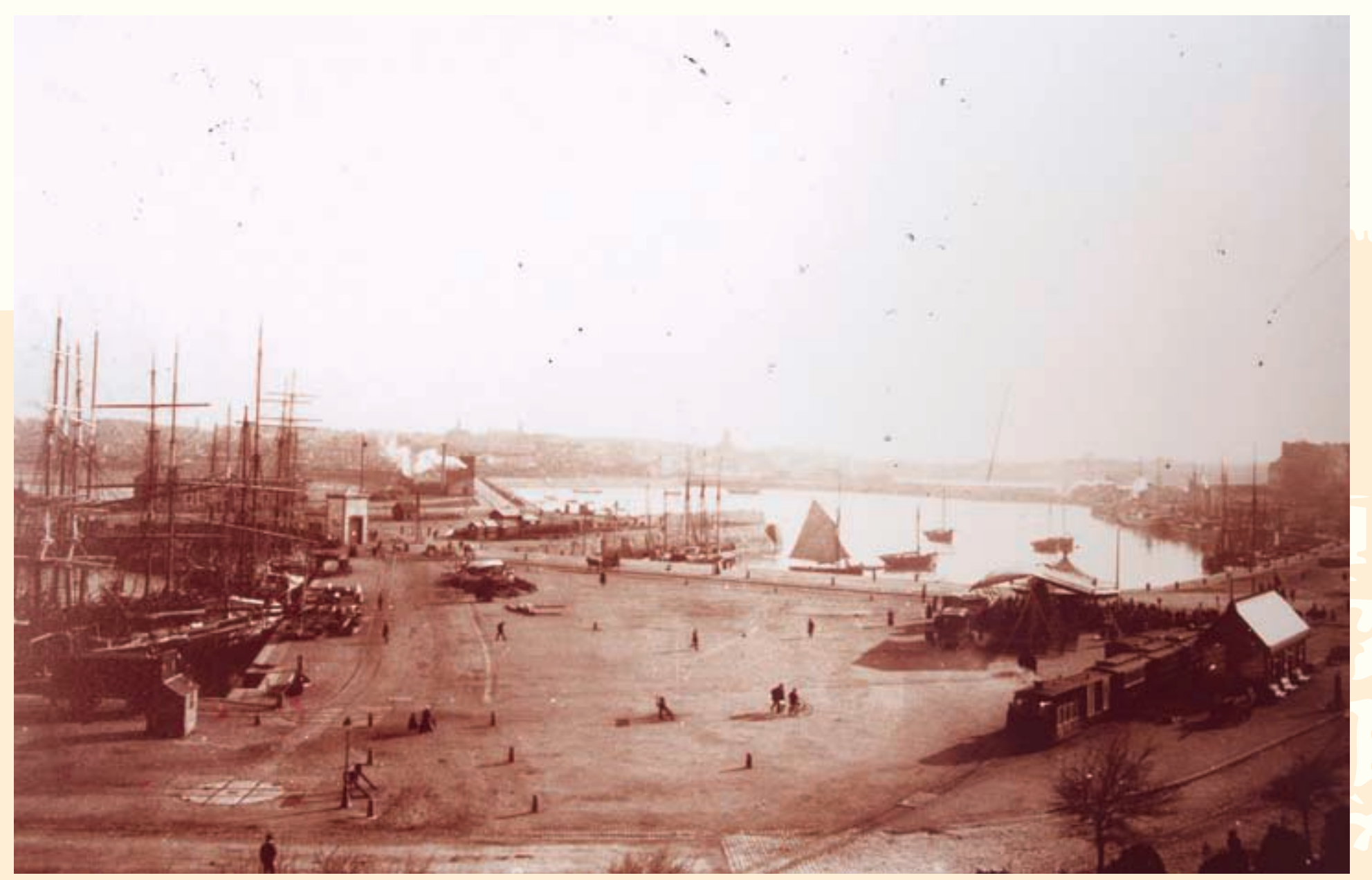
Saint-Malo, vue sur les bassins prise du château. Photographie, vers 1900, MSM.