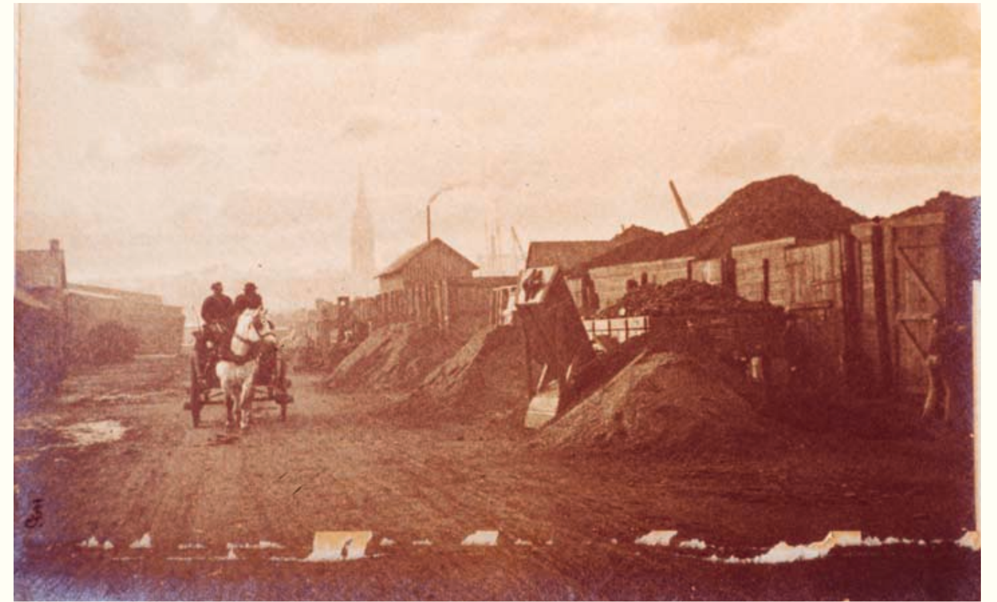
Saint-Servan, les entrepôts de charbon au début du XX e siècle. Photographie, vers 1900, MSM.

Au lendemain de la seconde guerre mondiale, les destructions ne permettent qu'une reprise lente des activités à partir de 1948. Mais c'est surtout après 1951, date de réouverture de la grande écluse que Saint-Malo s'affirme comme premier port de voyageurs de Bretagne (liaisons avec les îles Anglo-normandes et la Grande-Bretagne) et se classe au 7 e rang pour la France. Pour les marchandises, les trafics s'organisent surtout autour des importations : pétrole au lieu du charbon, phosphates et bois pour la construction et l'ameublement.