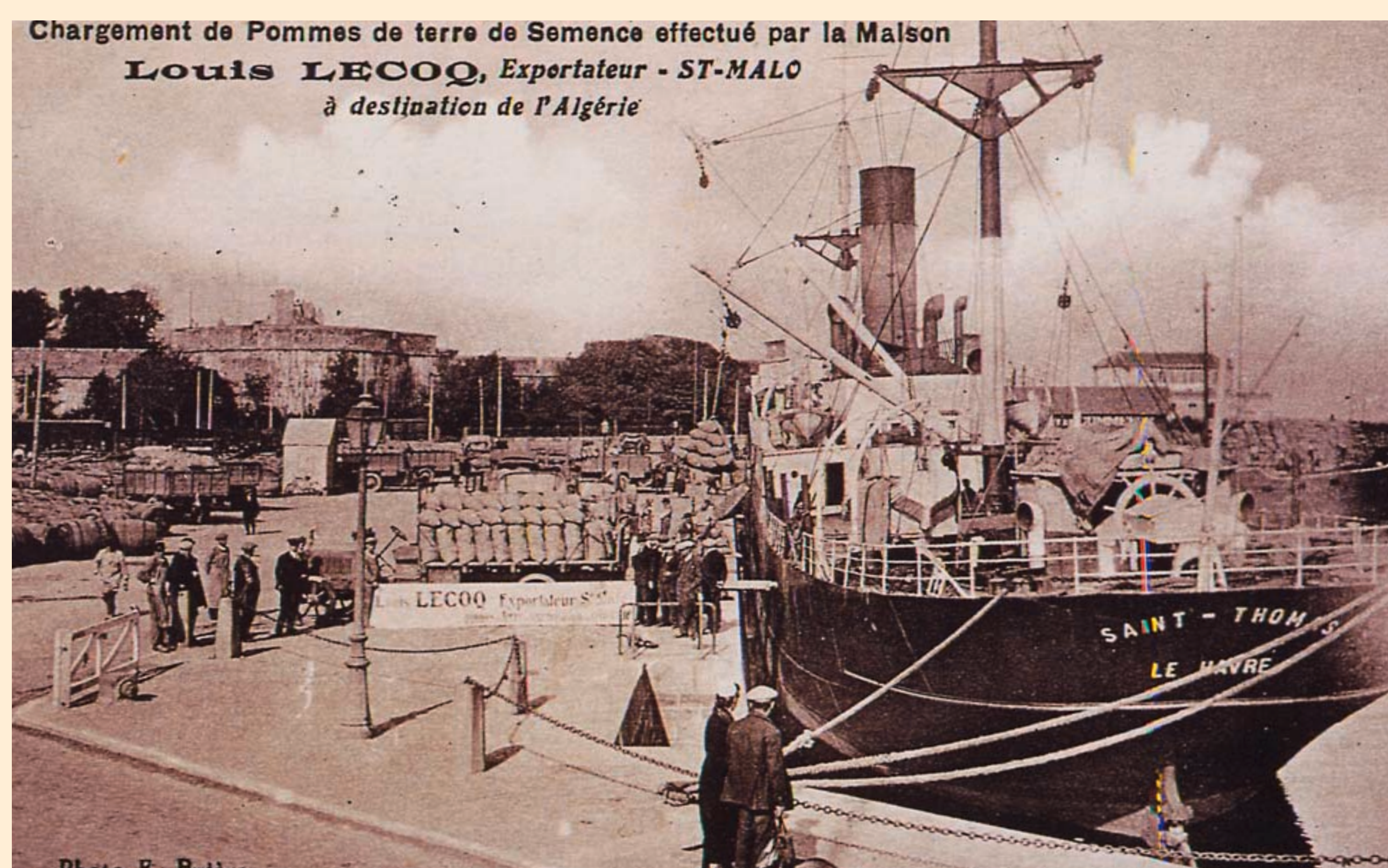
Chargement de pommes de terre à destination de l'Algérie. Carte postale, éd. Brière, début XX e siècle, ADIV.